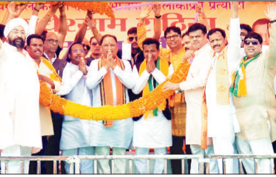
जनसभा में सीएम का स्वागत करते पदाधिकारी।