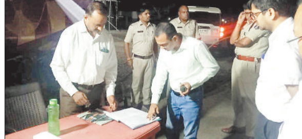
चेक पाइंट की जानकारी लेते कलेक्टर व एसपी।