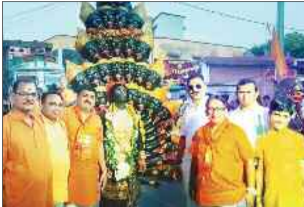
पथलगांव । शोभायात्रा में मां काली के स्वरूप के साथ शामिल भक्त ।