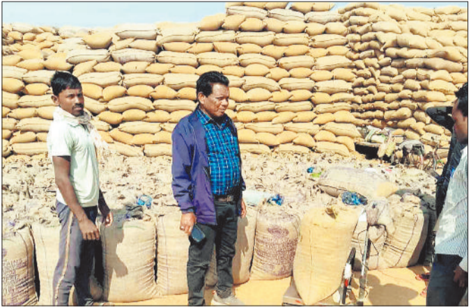
समिति पेटला में तहसीलदार साहब द्वारा धान खरीदी का निरीक्षण करते हुए।

शासन के निर्देश पर इस बार सहकारी समितियों द्वारा बम्पर धान की खरीदी की गई है लेकिन समय पर उठाव नहीं होने के कारण समिति प्रबंधकों को अब धान की मात्रा में कमी आने का भय सता रहा है। प्रारम्भ में विपणन संघ द्वारा स्थानीय मिलरों से धान का उठाव कराया गया। धान खरीदी बंद होने के 2 महीने बाद तक मिलर धान का उठाव करते रहे। अब धान के स्थानीय गोदाम फूल होने के बाद दूसरे जिलों के मिलरों से शेष धान का उठाव कराया जा रहा है। अधिकारी मिलरों को डिलीवरी आर्डर जारी कर देने का दावा कर रहे हैं लेकिन अभी भी उठाव में तेजी नहीं आई है। हालत यह है कि सरगुजा की 54 में से 52 उपार्जन केन्द्रों में अभी की 44 हजार 185 विंटल धान खुले आसमान के नीचे पड़ा है। बलरामपुर-रामानुजगंज में 49 उपार्जन केन्द्रों में से 48 केन्द्रों में 3 लाख 9 हजार 717 विंटल धान, कोरिया के 54 में से 50 केन्द्रों में 2 लाख 21 हजार 274