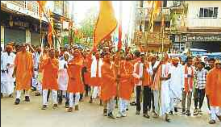
भगवा झंडे के साथ शोभायात्रा में शामिल रामभक्त ।