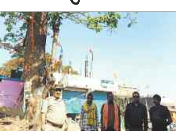
एक्सपर्ट टीम द्वारा मधुमक्खियों के हटाए जा रहे छत्ते ।

जशपुरनगर । जिला मुख्यालय सहित पथलगांव, कांसाबेल और कुनकुरी, बगीचा विकासखण्ड में मधुमक्खियों के अनगिनत छत्तों को लेकर आम लोगों के साथ ही खास लोगों में बढ़ती असुरक्षा को देखते हुए डीएफओ की पहल पर जिला प्रशासन ने महत्त्वपूर्ण कदम उठाए हैं। इसी कड़ी में आज बगीचा नगरीय क्षेत्र में एसडीएम, सीएमओ एव वन विभाग के अधिकारियों की उपस्थिति में मधुमक्खी छत्ता निकालने का कार्य बाहर से आए एक्सपर्ट टीम के द्वारा प्रारंभ कर दिया गया है। कुछ दिन एक्सपर्ट टीम जिले में ही रहेंगे तथा मधुमक्खी छत्ता निकालने जैसे कार्य करेंगे।